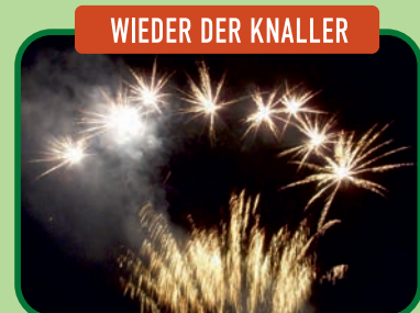
WIEDER DER KNALLER