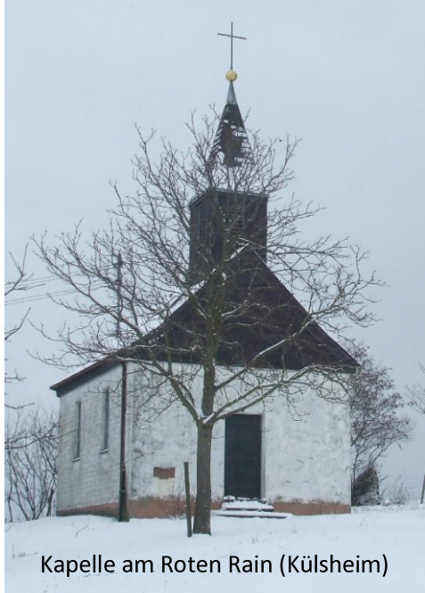
Kapelle am Roten Rain (Külshheim)