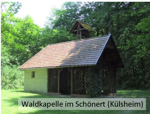
Waldkapelle im Schönert (Külshheim)