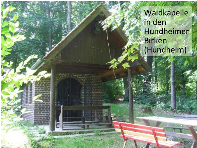
Waldkapelle in den Hundheimer Birken (Hundheim)