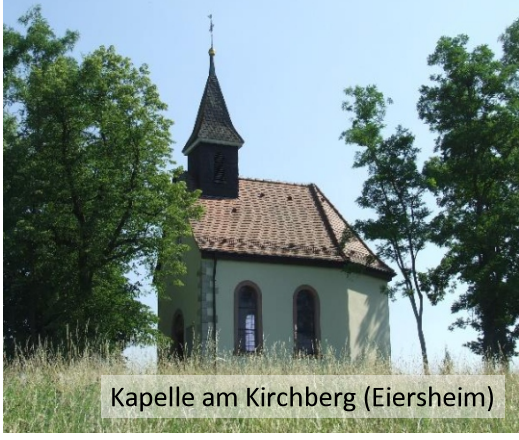
Kapelle am Kirchberg (Eiersheim)