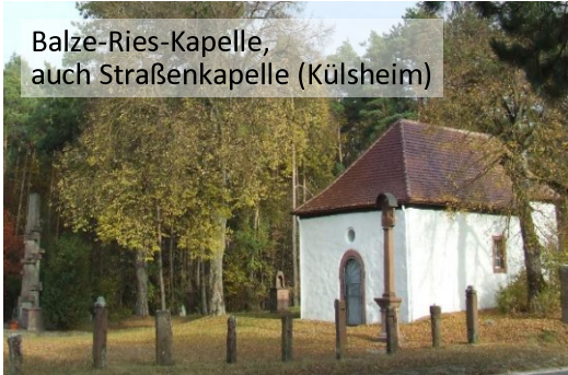
Balze-Ries-Kapelle, auch Straßenkapelle (Külshheim)