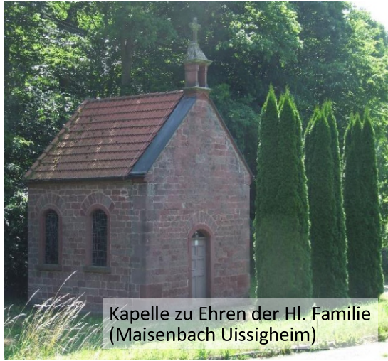
Kapelle zu Ehren der Hl. Familie (Maisenbach Uissigheim)