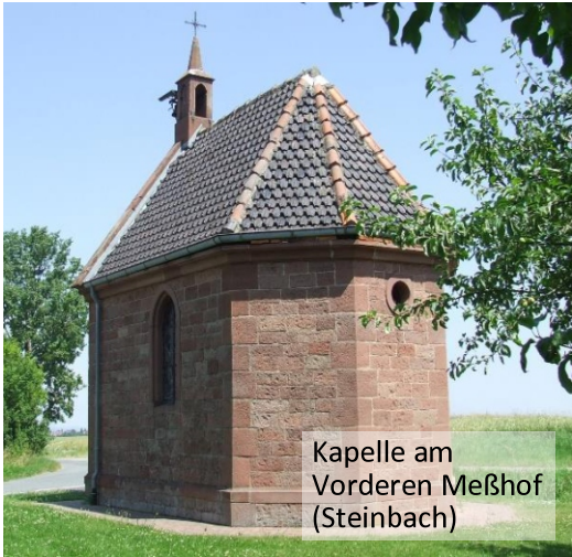
Kapelle am Vorderen Meßhof (Steinbach)