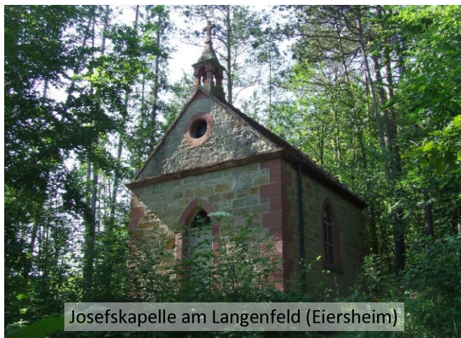
Josefskapelle am Langenfeld (Eiersheim)